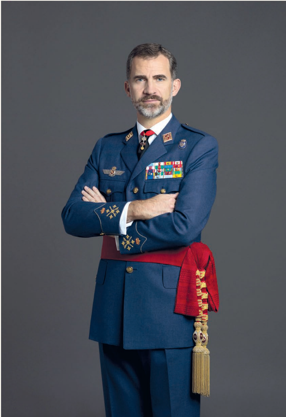
S.M. El Rey Don Felipe VI Hermano Mayor Honorífico de esta Hermandad